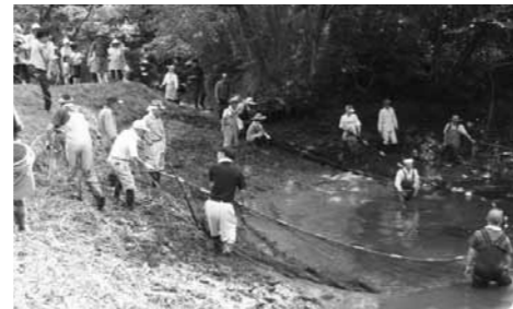
▲農業を支える巧みな水管理

GIAHS Globally Important Agricultural Heritage Systems 【問い合わせ先】産業政策課 世界農業遺産推進室 ☎ 23-2281 sangyo@city.osakimiyagi.jp