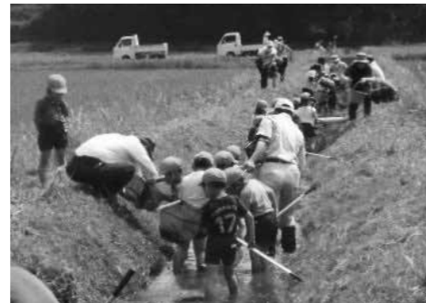
▲おおさき生きものクラブによる人材育成

これらの危機に対して大崎地域の農業は、ふゆみずたんぼや環境保全型農業の拡大、持続可能な未来のための人材育成を行うなど、伝統的な水利システムと地域環境の保全を両立する、持続可能な方策を打ち出してきました。これが、未来につなげたい農業システムです。