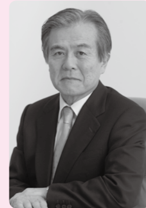
プラチナ構想ネットワーク会長 三菱総合研究所理事長 第28代東京大学総長 こみやま ひろし 小宮山 宏 氏

東京大学工学部化学工学科を経て、東京大学大学院博士課程修了(工学博士)。世界が求めている「地球環境問題を解決した元気な超高齢化社会」である、『プラチナ社会』の実現に向けて、プラチナ構想ネットワークを組織して取り組んでいる。