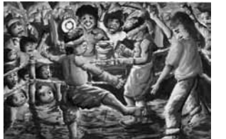
▲『ムエタイ』(タイ・15歳)