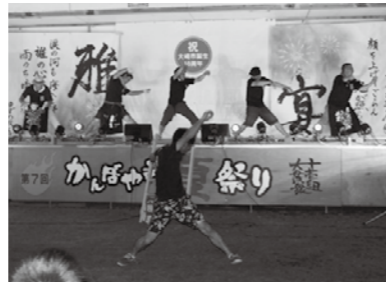
▲まつりの締めは大貫衆十壱組の伝統となった「よさこい踊り」

さらに、この流れは田尻地域全体へと波及し、地区の垣根を越えて持続的な地域づくりを進める青年組織「360°-ON-TAJIRI(さびろく・おん・たじり)」結成へと結びついています。