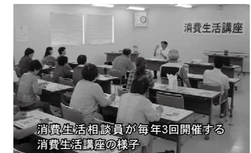
消費生活相談員が毎年3回開催する消費生活講座の様子

発足当時、着色料や食品添加物が大量に使用された駄菓子などが当たり前のように販売されており、不信感を抱えた消費者が数多くいました。当時は、今ほど食品添加物や農薬に対する世間の認識は低く、食品メーカーが売り出した商品の問題性を訴え