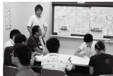
▲お祭りワークショップに集まった大貫地区の若者たち

ワークショップでは「地区の行事は高齢者ばかりで若者向けではない」などの率直な意見が多く出された一方で、「地域の同世代にこんな人がいたんだ」とつながりが生まれる場となり、回が進むにつれ「大間のマグロを釣って大宴会をしよう」など、実現