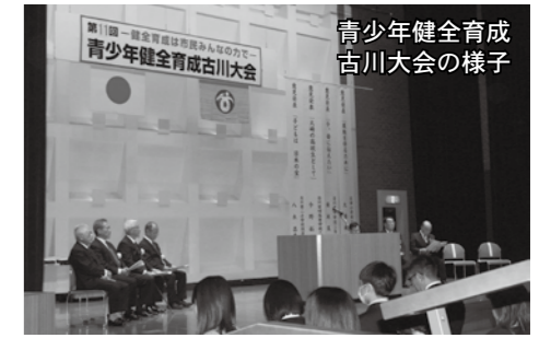
青少年健全育成古川大会の様子

わたしがPTA活動に参画していたころは、授業中に教室を抜け出してしまうような、いわゆる「やんちゃな子」が少なからずいました。今にして思えば、基礎的な理解が進まないまま授業についていくことが苦しかったのではないかと。ゆっくりでいいから、理解のステップを着実にのぼり、分