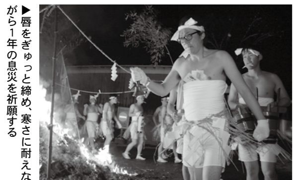
▶唇をぎゅっと締め、寒さに耐えながら1年の息災を祈願する

裸参りは三本木地域と田尻地域で毎年行われています。年頭の祈願と厄払いに、来年は皆さんも参加してみませんか。