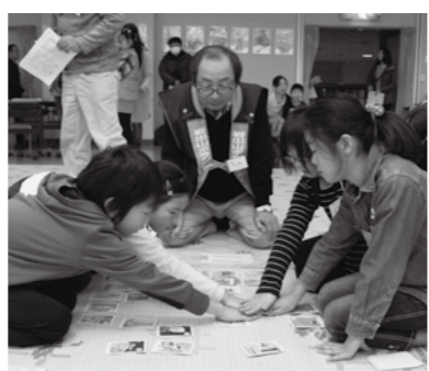
▲われ先にと取り札に手がのびる

横10m、縦6.5mのジャンボすごろくは、2人1組がサイコロを振る人とコマとなって、行きつ戻りつゴールを目指しました。