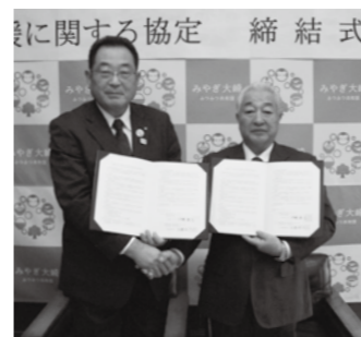
▲協定書を取り交わし、ライフラインを守る応援体制が確立