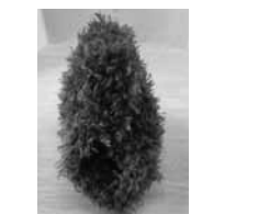
▲ネックウォーマー