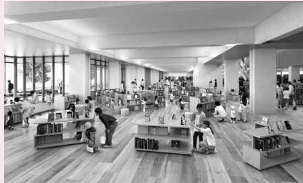
▲新図書館内観イメージ

「来楽里ホール」には“来て楽しい里”という意味と、集まる人々の笑顔がきらりと光るといいな、という願いが込められています。