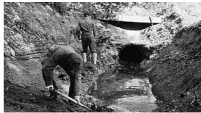
▲ 370年受け継がれている南原穴堰の管理

南原穴堰は、370年以上経った現在でも、地縁の相互扶助組織「契約講」を基層とした人々の手によって、維持管理され続けています。開削当時の用水機能や防火用水、生活用水機能を維持しており、今日生きる人々の生活を支えています。