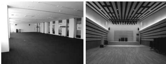
▲研修室1~3(移動パネルをあけて1部屋にした状態)