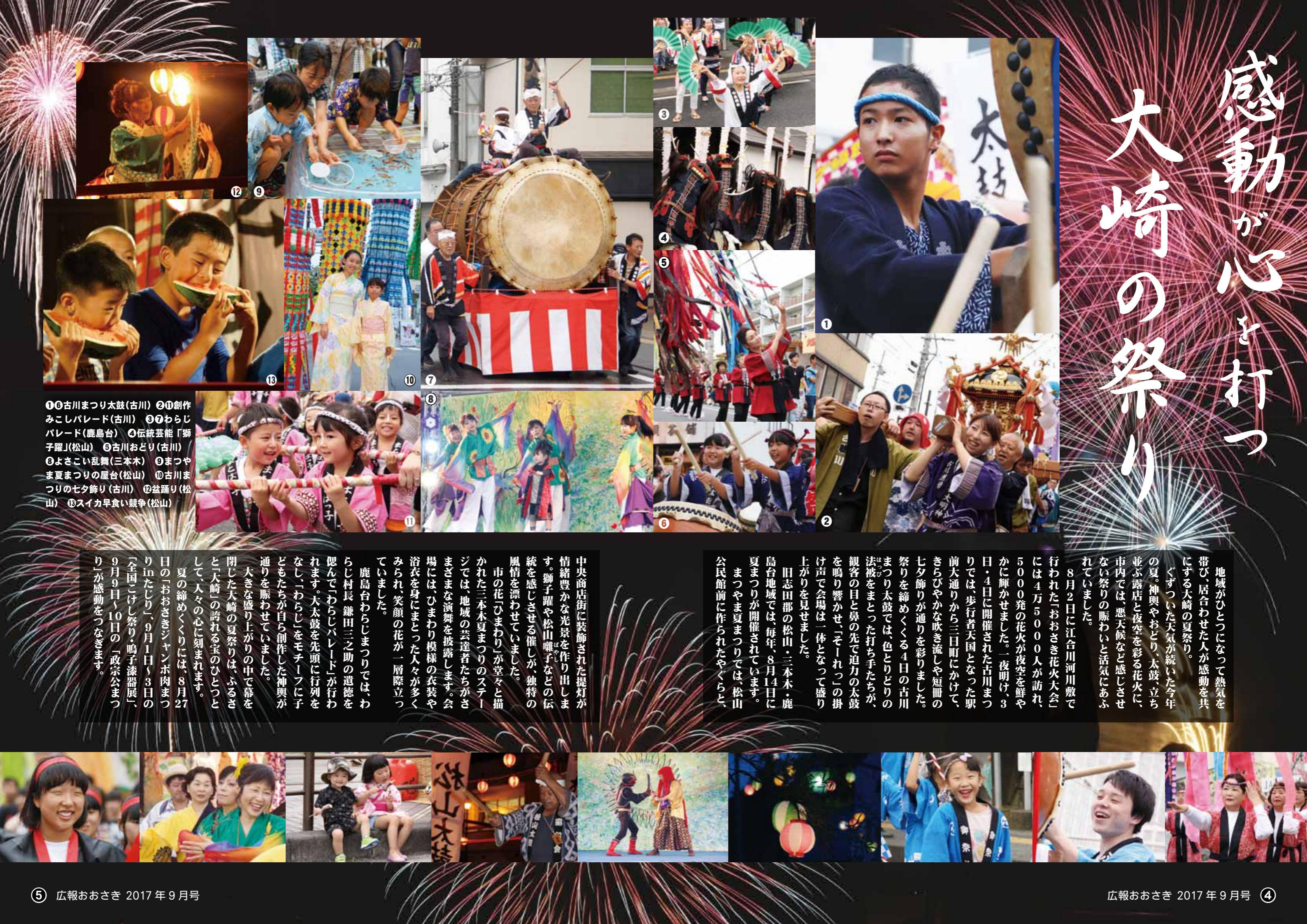
①古川まつり太鼓(古川) ②創作 みこしパレード(古川) ③わらじ パレード(鹿島台) ④伝統芸能「獅子 躍」(松山) ⑤古川おどり(古川) ⑥よさこい乱舞(三本木) ⑦まつや ま夏まつりの屋台(松山) ⑧古川ま つりの七夕飾り(古川) ⑨盆踊り(松 山) ⑩スイカ早食い競争(松山)

地域がひとつになって熱気を帯び、居合わせた人が感動を共にする大崎の夏祭り。 ぐずついた天気が続いた今年の夏。神輿やおどり、太鼓、立ち並ぶ露店と夜空を彩る花火に、市内では、悪天候など感じさせない祭りの賑わいと活気にあふれていました。