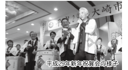
平成29年新年祝賀会の様子

日時 1月4日(木) 17時30分開会 場所 芙蓉閣(古川駅前大通) 対象 市民、大崎市に関わりのある人 料金 3,500円 申込 12月8日(金)までに、料金を添えて申込先の窓口へ申し込み 申込先 秘書広報課、各総合支所地域振興課、古川商工会議所、大崎商工会本所・支所、玉造商工会、JA古川、JAみどりの、JAいわでやま