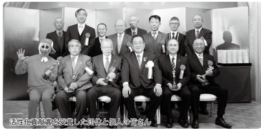
活性化貢献賞を受賞した団体と個人の皆さん