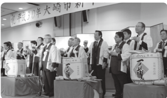
▲大崎市の地酒で乾杯