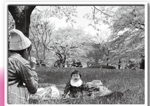
「化女沼の春」 高橋 達也さん (石巻市) 撮影地: 化女沼(古川地域)