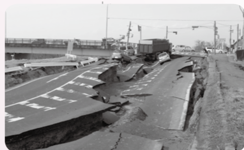
▲震災直後の古川江合橋付近の道路。被害の大きさを物語っています。