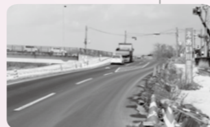
▲復旧した古川江合橋付近（平成24年2月撮影）