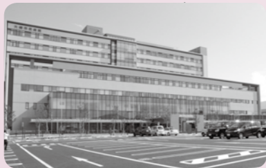
▲県北地域の基幹病院として、さらに、災害拠点病院として、平成26年7月に大崎市民病院が開院しました。