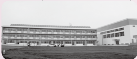
▲校舎の建て替えを行った古川東中学校。震災直後、生徒は古川西・古川北・古川南中学校へ分かれて通学しました。平成26年4月に新校舎が完成しています。