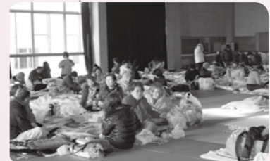
▲震災直後は、ライフラインが停止し、多くの市民が避難所に身を寄せました。