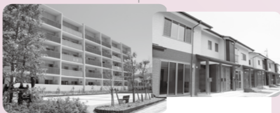
▲震災で自宅を失った人たちが入居できる災害公営住宅は平成27年度までに市内6箇所（古川七日町住宅、古川駅前大通住宅、古川十日町住宅、鹿島台姥ヶ沢住宅、田尻沼部住宅）の建設が完了しています。