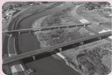
▲壊滅的な被害をうけた志田橋は、平成28年3月に開通しました。写真手前が新志田橋、奥が旧志田橋。