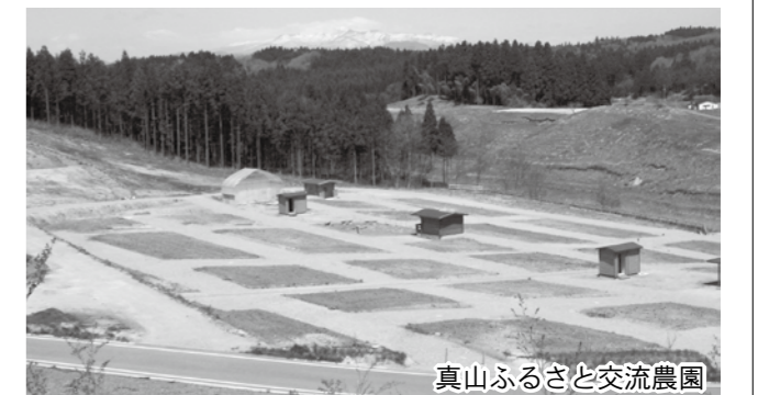
真山ふるさと交流農園

申込 上古川ふれあい農園管理組合まで電話(☎22-3547)で申し込み(随時受け付け)