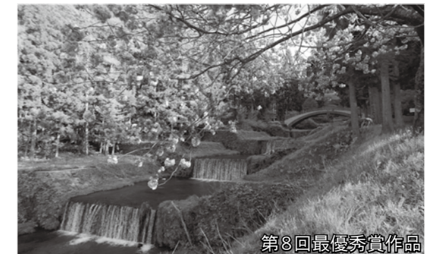
第8回最優秀賞作品

市の魅力の再発見と新たな観光資源の発掘を目的に「第9回おおさき観光写真コンテスト」の作品を募集します。入賞作品・応募作品は、市内観光施設やJR陸羽東線主要駅に展示します。