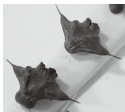
▲菱は沼や川に生える水草で、昭和初期まで品井沼で収穫されていました

のです。歌詞には、船に乗って菱をとり、雉が鳴く様子などが歌われています。菱の収穫期には、菱取り唄や品井沼を見物する人でにぎわい、地域の名物であったことが記録に残っています。