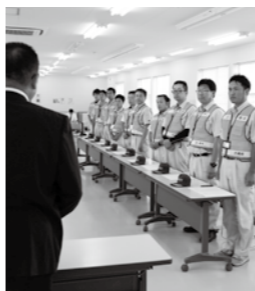
▲宇和島市への派遣出発式に臨む市職員

市では、支援活動として、いち早く飲料水を届けることもに、被災された皆さんの一日も早い復旧・復興を応援するため支援金を届けています。さらに、8月27日～12月28日の4カ月間にわたり、道路や河川などの災害復旧にかかる災害査定が発注、監督などに