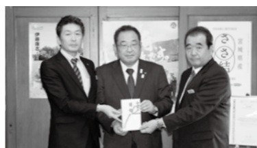
▲12月14日、東北電力(株)古川電力センター、(株)ユアテック古川営業所からLED防犯灯30灯が寄贈されました