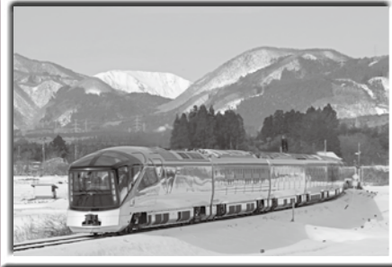
「新春の禿岳を往く」 高橋 隆志さん 撮影地：小黒ヶ崎(鳴子温泉地域)