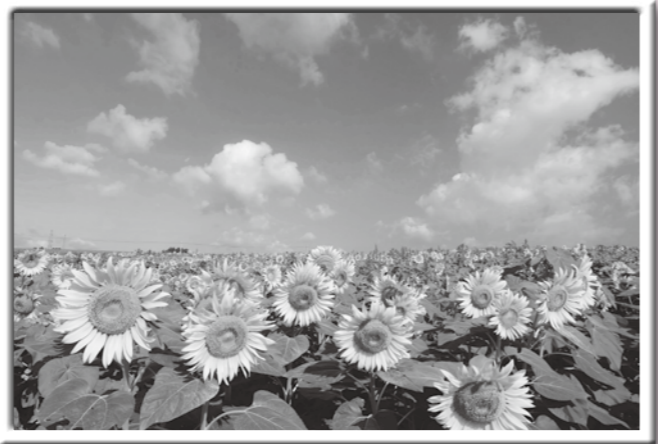
「ひまわり地平線」 高橋 達也さん 撮影地：ひまわりの丘(三本木地域)