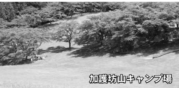
加護坊山キャンプ場

噴火によってできた国内有数の強酸性のカルデラ湖です。ボートや遊歩道があり、自然散策も楽しめます。天気や季節によって、エメラルドグリーンなどさまざまな色に変化する湖面は、幻想的な雰囲気です。 ※11月下旬から4月下旬までの期間は冬期閉鎖となります。