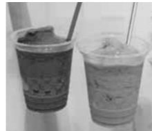
▲ カフェのぼのテイクアウトメニュー。ブルーベリー・ラズベリーシェイク。