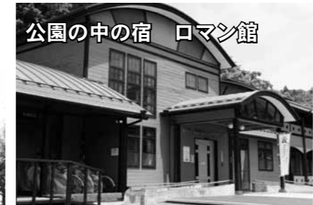
公園の中の宿 ロマン館