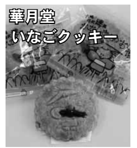
華月堂 いなごクッキー

世界農業遺産に認定された大崎耕土で育った、「いなご」を粉末にして生地に練りこみ、いなごの佃煮を乗せて焼き上げたクッキーです。