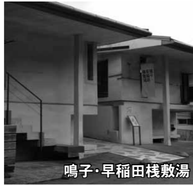
鳴子・早稲田棧敷湯