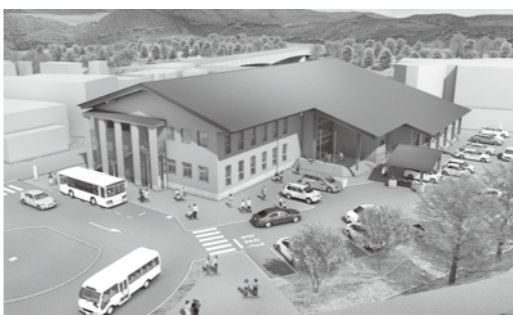
▲新庁舎完成予想図