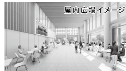
屋内広場イメージ