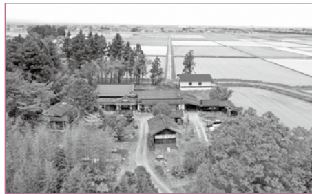
▲上空から撮影した居久根

大崎耕土ウェブサイト( https://osakikoudo.jp )に掲載している応募用紙に必要な事項を記入の上、メール(osaki-giahs@city.osaki.miyagi.jp)または郵送(〒989-6188 大崎市古川七日町1番1号 大崎市世界農業遺産推進課あて)で応募してください。