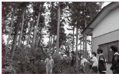
▲居久根の見学会などの受け入れ