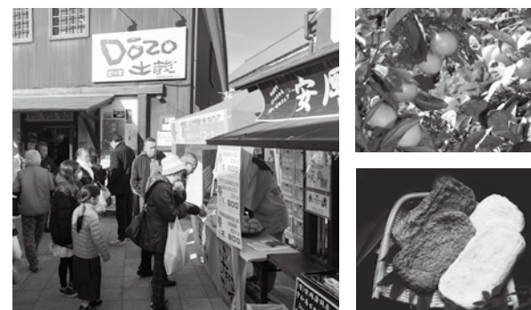
▲昨年のフェアの様子

日時 12月19日(土)~30日(水) 場所 大崎市観光物産センターDōzo 内容 宇和島産みかん、じゃこ天などの販売