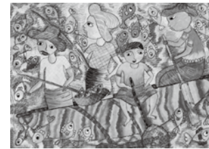
「漁業」スリランカ・10歳

世界各国の3歳から15歳までの児童画および昨年度の宮城県展入選作品をおよそ300点展示します。子ども達の力作を観覧しませんか。