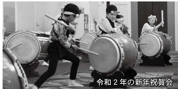
令和2年の新年祝賀会

令和3年がコロナ禍を乗り越え明るい年となるよう祈念するとともに、本市の活性化に先導的な役割を果たした方々を顕彰します。ぜひご参加ください。