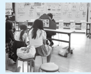
▲紙芝居を用いて食育の大切さを伝えていきます

市では、市民の皆さんが健康で心豊かに暮らせるように、食文化や古くから伝わる食文化など、地域の資源を生かした食育をするために、「第2次大崎市食育推進計画」を策定しているよ。今年度は、計画の内容を振り返ったり、社会の変化などを参考にしたり、計画を見直す改訂版を発行する予定なんだ。 今月から、教育機関や農業関係団体などの食育の普及に関係する人たちから市民の皆さんへ、世界農業遺産