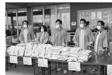
▲新米まつりでの『ささ結』の販売

大崎市内の小中学校を対象とした『ささ結』学校給食 日時 11月8日(月)~12日(金) 姉妹都市東京都台東区へ新米の贈呈、小中学校を対象とした『ささ結』学校給食 日時 11月11日(木) コロナに負けず、対策万全に、新たな生活様式に対応したイベントの開催へ 新型コロナウイルス感染症により、外食需要の低迷が続いています。コロナに負けず、地域で連携した新たなアイデアで、世界農業遺産ブランド認証米の『ささ結』の消費拡大や販売促進イベントを実施していきます。