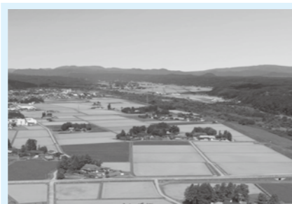
居久根が織りなすランドスケープ

私たちの周りには当たり前のようにある「居久根」ですが、地域の宝であることを認識してもらえよう、さまざまな事業に取り組みます。