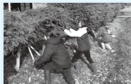
ボランティアによる居久根保全体験会