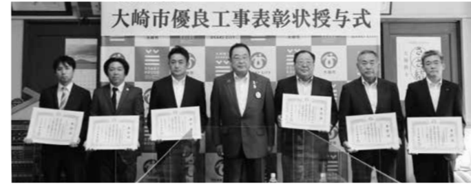
▲優良業者の皆さん(左から菅基建設(株)、(株)環境産業、(株)富士土木、丸岩運輸建設(株)、柏原建設(株)、日本植生(株)仙台営業所)