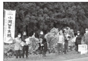
▲小瀬菜大根収穫後の記念撮影