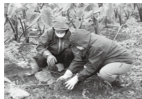
▲上伊場野里芋の収穫