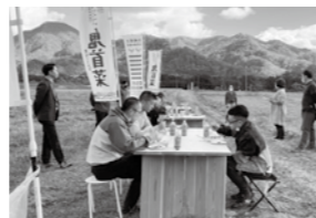
▲鬼首の雄大な自然の中で鬼首菜弁当のランチ