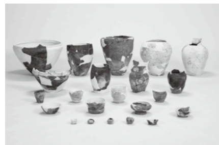
▲通木田中前遺跡出土遺物