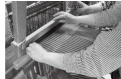
織り機を使い、手と足を動かして制作するタペストリー