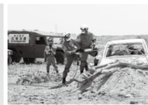
水害を想定したさまざまな救助・救出訓練