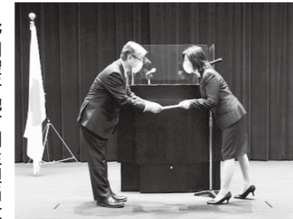
野田聖子地方創生担当大臣から高橋副市長へ認定証が授与されました