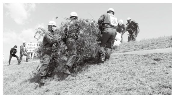
松山地域水防団による水防工法(木流し工)

5月29日、古川地域(江合川河川公園付近)を会場に、北上川下流及び江合川・鳴瀬川総合水防演習を、国土交通省東北地方整備局と宮城県、本市を含む、北上川下流・鳴瀬川流域の14市町村の協力のもと実施しました。