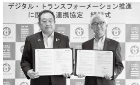
市民サービス向上のため連携してDXの推進に取り組んでいきます