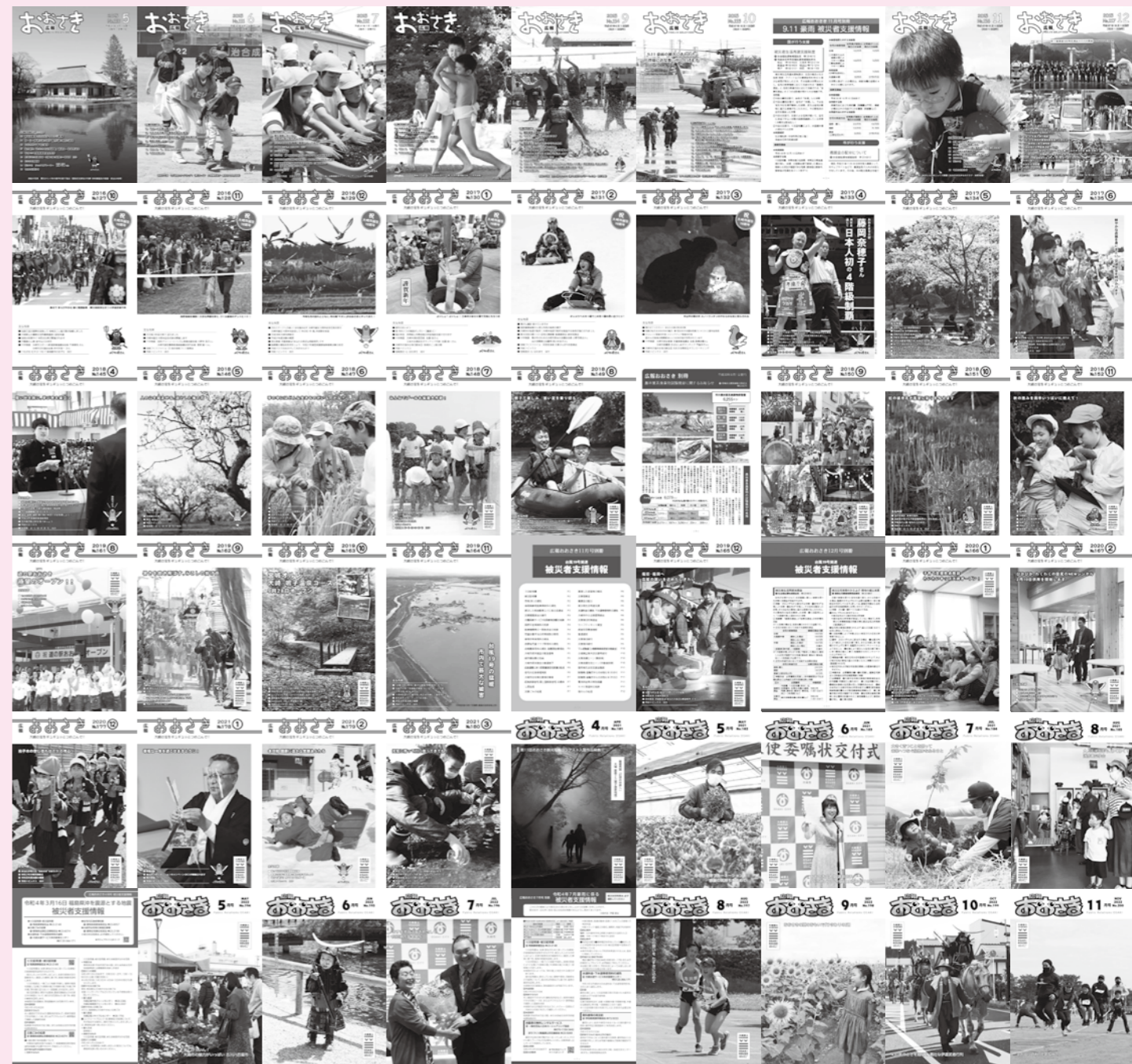
101号から200号までを紹介しています

令和元年5月158号では、新元号「令和」の始まりを記念して、心に残っている「平成」の出来事取材し、略年譜と共に紹介しました。