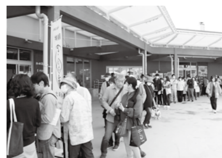
▶新米を買い求める長蛇の列

11月1日(火)から12月28日(水)まで開催の、第5回「ささ結」新米フェア2022や大崎「ささ結」寿司キャンペーン、25日(金)開催の第6回全国ササニシキ系「ささ王」決定戦2022など、大崎の食の恵みを堪能する催しが目白押しとなっています。今年も、宝の都(くに)・大崎の新米を、ぜひ味わってみてください。