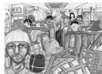
◀「バスの中で」13歳(インドネシア)

世界中を巡回している展覧会です。県の入賞・入選作品を含む、世界各国の3歳から15歳までの作品約300点を展示します。