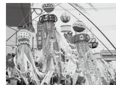
◀個性豊かな吹き流しが並びました

また、地域交流センター(あすも)では、東京都台東区の伝統工芸職人による江戸下町職人展や姉妹・友好都市のうまいものが一堂に集結した「うまいものフェア」の開催、短冊に願いをつづった短冊ロードも設置され、まつりに彩りを加えました。