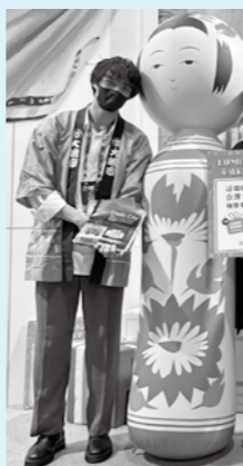
▲台湾で開催されたイベントへ参加

また、「台湾人から見た『大崎市の魅力』が知りたい!」というときには、気軽に連絡ください。どうぞよろしく願いいたします。