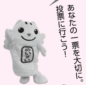
▲明るい選挙のイメージキャラクター「選挙のめいすいくん」

投票するときに、不安や心配なことはありませんか。投票をしたいけれど「投票の手順が分からない」「今まで投票に行ったことがない」といった皆さんの不安に、職員が寄り添って丁寧に案内します。