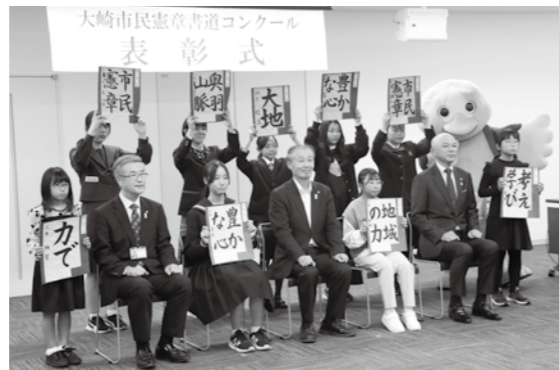
▲最優秀賞、優秀賞受賞者の皆さん

市内の小・中・義務教育学校27校から234点の応募があった令和5年度大崎市民憲章書道コンクールでは、審査を経て28点の入選作品を選定しました。 入選作品のうち、最優秀賞と優秀賞の受賞者へ向けた表彰式を、10月11日に行いました。表彰式の様子は市ウェブサイトに掲載しています。 入選作品は、11月9日(木)まで展示しています。子どもたちの力作を、ぜひ鑑賞してください。