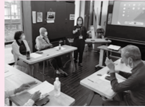
▲スマホ講座では分かりやすい説明を心がけています

私の任期はあと1年3カ月ですが、卒業まで頑張りますので、どうぞよろしくをお願いいたします。