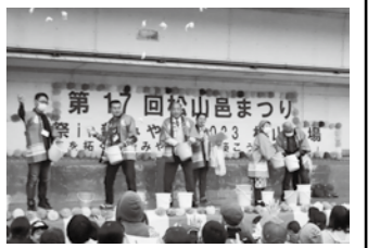
▲たくさんの人が盛り上がった餅まき

締めくくりの餅まきでは、今年にちなんだ2023個の紅白餅が勢いよく空を舞い、最後まで活気あふれる祭りとなりました。