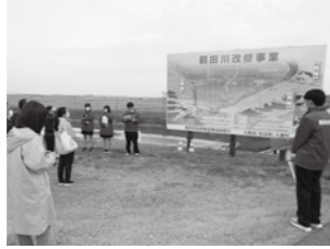
▲鹿島台商業高等学校の生徒によるツアーガイド

このような取り組みを通じ、住んでいる地域以外の世界農業遺産に触れ、興味・関心を広げることによって、世界農業遺産を次世代につなげていきます。