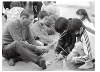
▲一生懸命しめ縄をないました