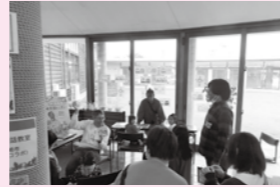
▲熱心に英会話を聞いている参加者

今後、田尻地域の子どもたちにも、楽しみながら異文化に触れられる機会を提供していきたいと考えていますので、その際はぜひ参加してください。