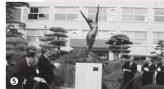
▲寄贈された「花の影」を披露した除幕式