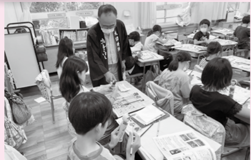
▲台東区の小学生を対象にした鳴子こけし絵付け体験(令和5年6月)