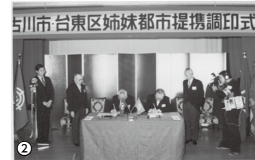
▲姉妹都市提携調印式