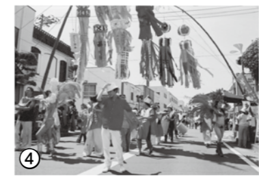
▲古川まつりで披露された浅草サンバカーニバル