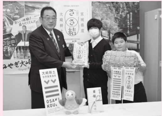
▲大崎市から台東区への給食用新米贈呈(令和5年11月)