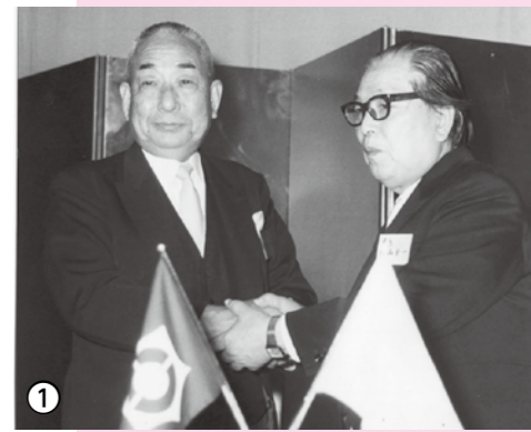
▲大衛照夫 元古川市長(左)と内山榮一 元台東区長(右)