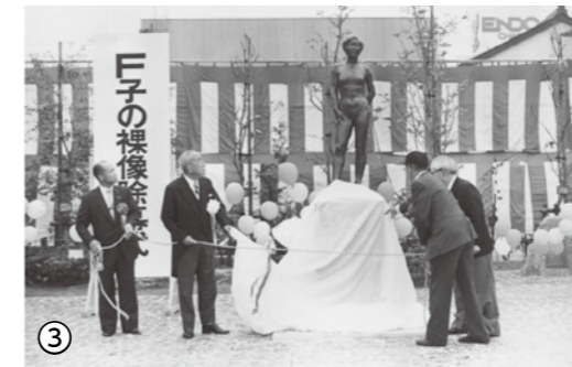
▲寄贈された「F子の裸像」を披露した除幕式