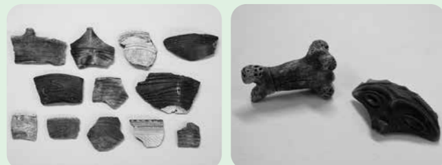
▲展示している縄文土器