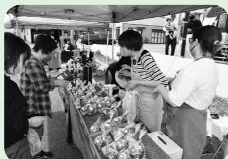
▲昨年の鹿島台駅前マルシェ