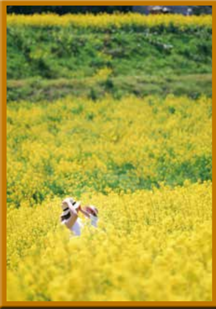
優秀賞(一般部門) 三本木小学校の同級生と