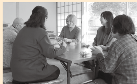
▲催しを企画・検討する民生委員・児童委員

地区ごとの月例会議に参加し、情報交換や地域の課題などを話し合います。また、必要な知識を得るための研修会にも参加します。