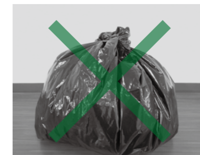
▲使用できない袋(中身が見えない色)