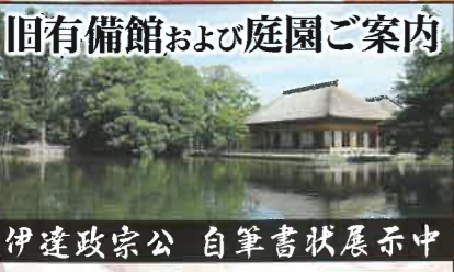
旧有備館および庭園ご案内

伊達政宗公 自筆書状展示中 政宗公まつり開催期間中は 入館料無料! 9月10日(土) 9時～17時 9月11日(日) 9時～17時 お茶会(朝野社中) 9月11日(日) 10時～14時 (限定80席・一席300円)