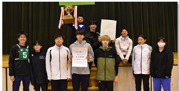
総合優勝した新町チームのみなさん