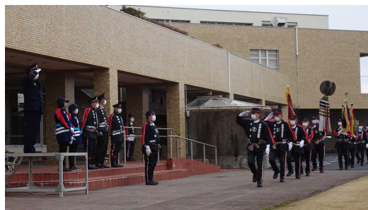
令和5年の田尻支団出初式

開催にあたり、当日7時30分に防災行政無線のサイレンを鳴らしますので、災害等とお間違えないようにご注意ください。