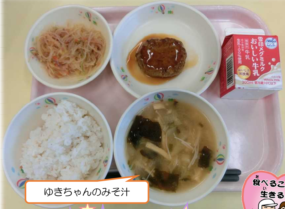
ゆきちゃんのみそ汁