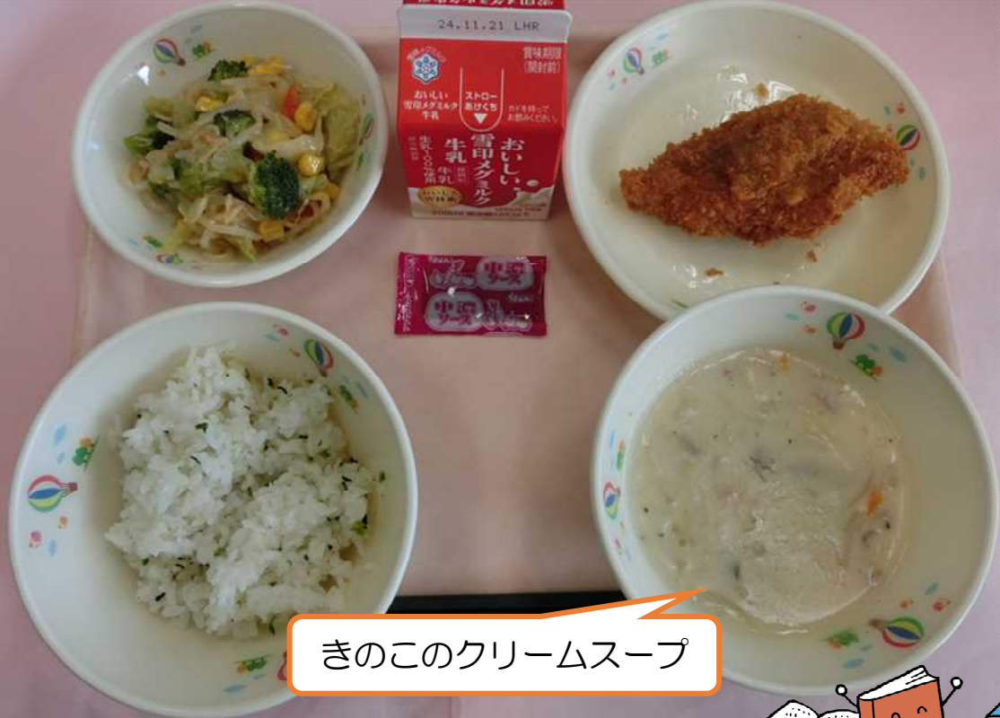
きのこのクリームスープ