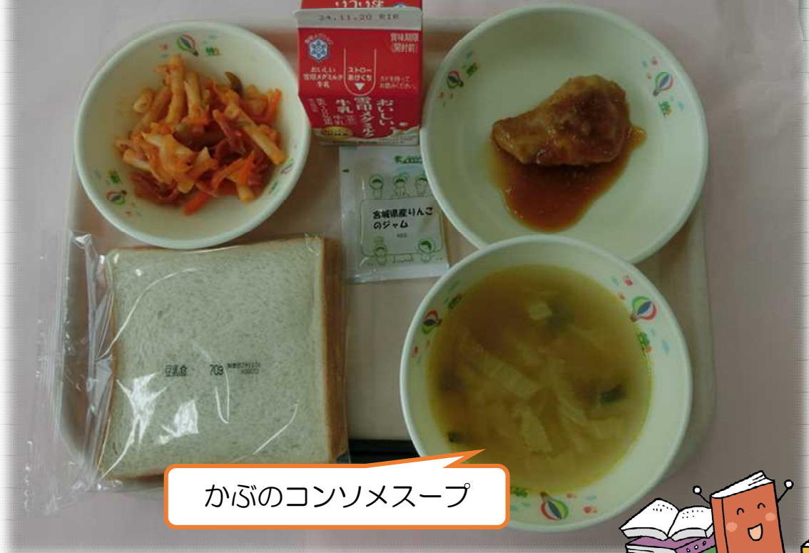
かぶのコンソメスープ