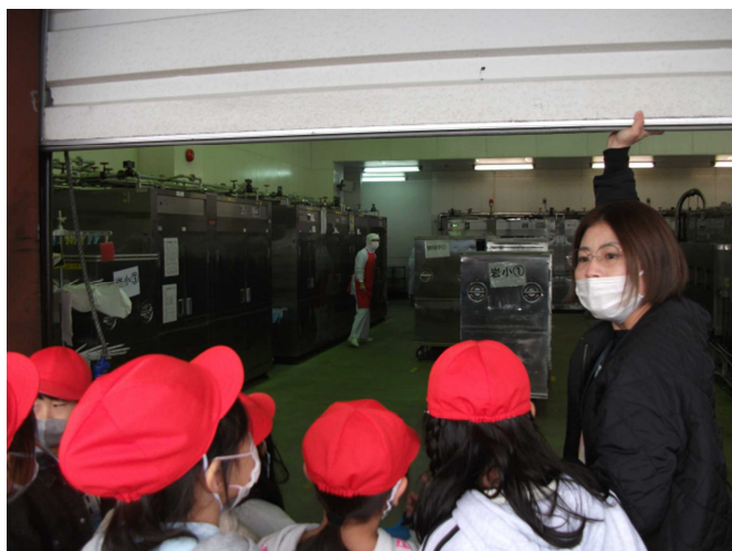
【食缶を運ぶコンテナが並んでいるところです】