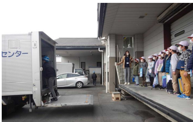
【配送車の中やコンテナを積み込むところを見学しています】